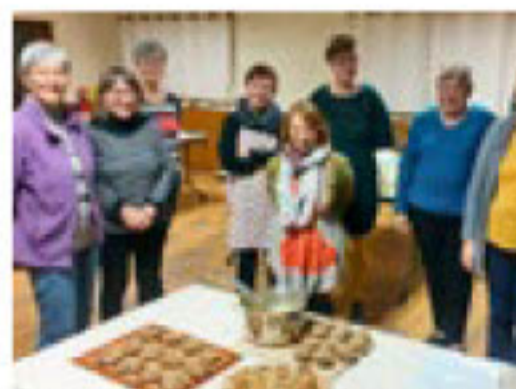
Atelier de cuisine anti-gaspi à Moutrot

Nous cherchons à développer des sites de compostage partagé dans les quartiers où c'est possible. Pour cela, nous rencontrons les élus du territoire, mais aussi les habitants, lors de réunions organisées sur la thématique ou en porte-à-porte en menant une enquête de faisabilité. Sur le territoire, plusieurs sites ont vu le jour, à Colombey-les-Belles et à Favières. Ils fonctionnent bien, grâce à l'aide de bénévoles et des communes. Ce n'est pas suffisant, il faut en développer sur les autres communes où cela est nécessaire.