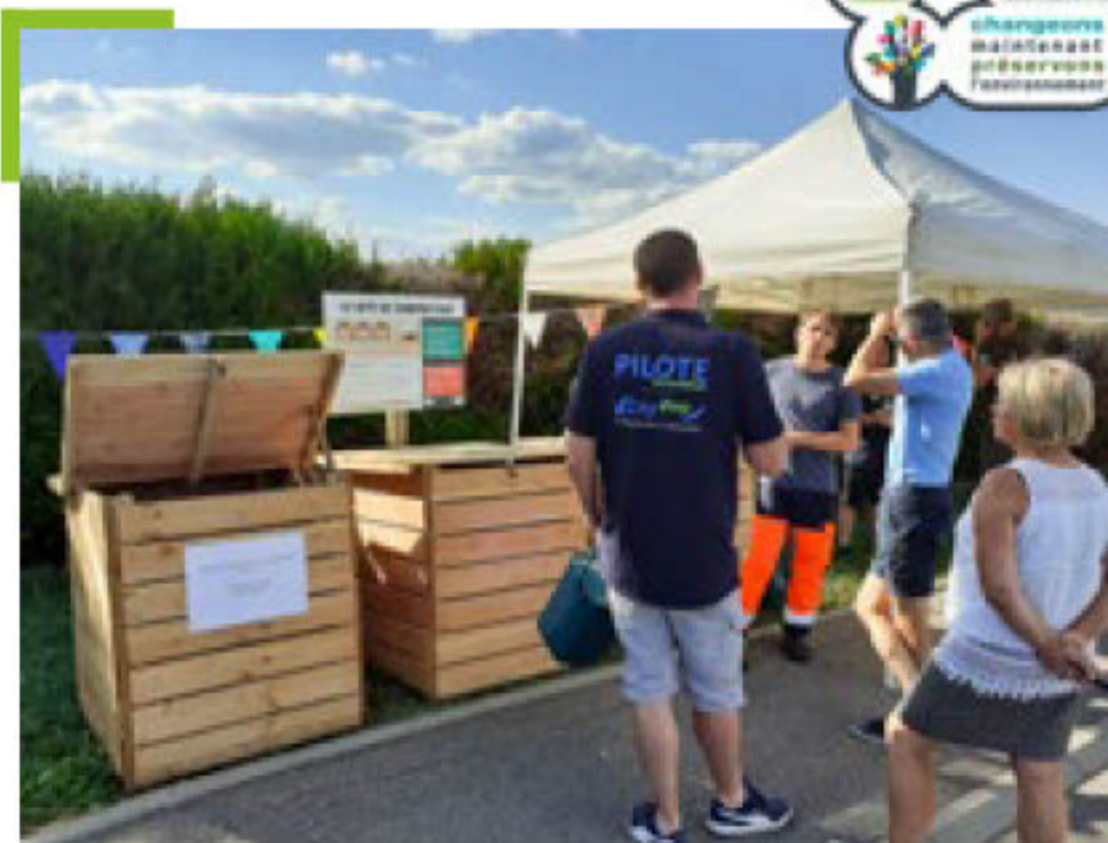
Inauguration du site de compostage partagé de Colombey les Belles